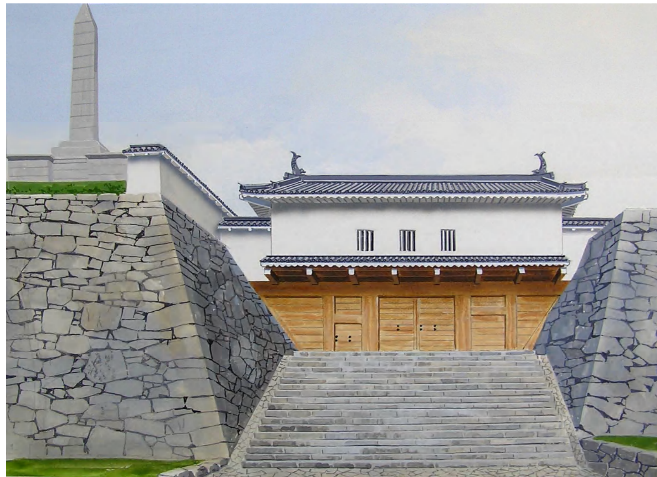
鉄門復元想定図（南側から）

格式の高い門なので、大手門や本丸正門などの主要かつ重要な門に使われます。屋根に鯨や装飾瓦を載せていることもあり、表門にふさわしい豪華な門です。