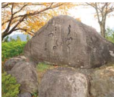
高村光太郎文学碑

文学碑のある高下地区は、冬至から年末にダイヤモンド富士を望むベストポイント。光太郎はこの地から眼前に迫る富士山を見て「こんな立派な富士は初めて仰いだ」と感嘆したそうです。