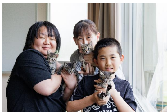
(照片 2 说明)