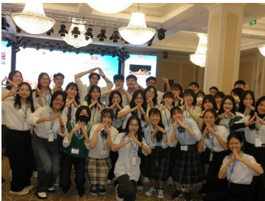
(照片 2 说明)