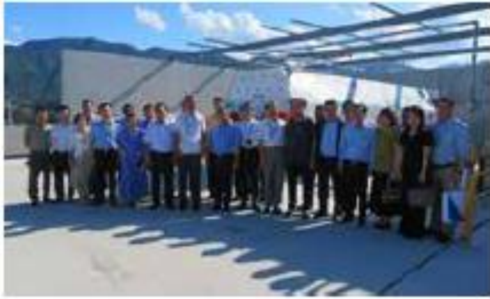
(照片 1 说明)