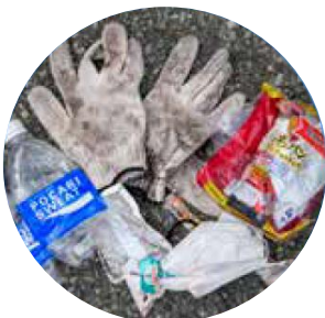
(照片 1 说明)