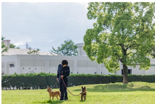
(照片 1 说明)

小猫们在牛奶志愿者那里度过了两个月。有泉一家将不得不与这些健康快乐成长的小猫说再见。我们很舍不得它们，但希望它们以后能过上幸福的生活。