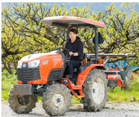
（照片 1 说明）