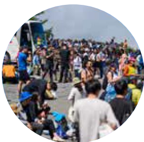
(照片 2 说明)