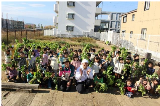
(照片 2 说明)