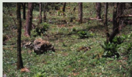
林の少し湿ったところに咲いている

山里に春の足音が聞えてくると、林に白いニリンソウが咲きはじめます。二輪の花を必ずつけるものと思われがちですが、一輪しかつけないものや三輪つけるものもあります。多年草で、高さは十五〜二十センチメートル。花茎を二〜三本立て、先端に直径約二センチメートルの花をつけます。花弁のように見えるのはガクで、まれに緑色のものがあり、これはミドリニリンソウと呼ばれているようです。ちなみにイチリンソウはニリンソウより大きく、直径四センチメートルほどになります。野山を歩くには良い季節。林のなかでひっそりと咲くニリンソウに出会いに行きませんか。