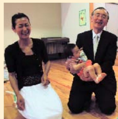
談議終了後、子どもを抱く横内知事

数力所あると助かる医療費助成制度の統一 市町村ごとにまちまちな医療費の助成を県内全域で統一してほしい。 * * * 談議は、知事自身が進行役をこなし、和やかな雰囲気の中で進められました。知事は「ファミリー