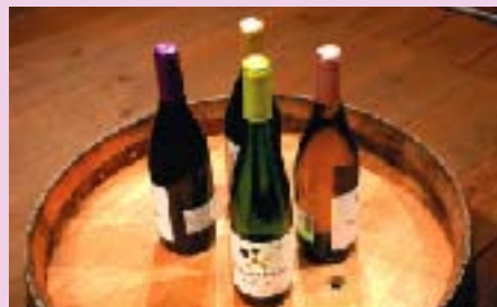
参加者の中央に置かれた自慢のワイン

談議の中では、「今日の知事さんのネクタイはワイン色ですが、偶然ですか」という質問が飛び出し、会場が笑いに包まれる場面もありました。知事は、「大いに啓発され、得るところが多い会合でした。山梨が、有数のワイン産地と言われるように、県としても頑張っていきたいと思えます」と感想を述べました。