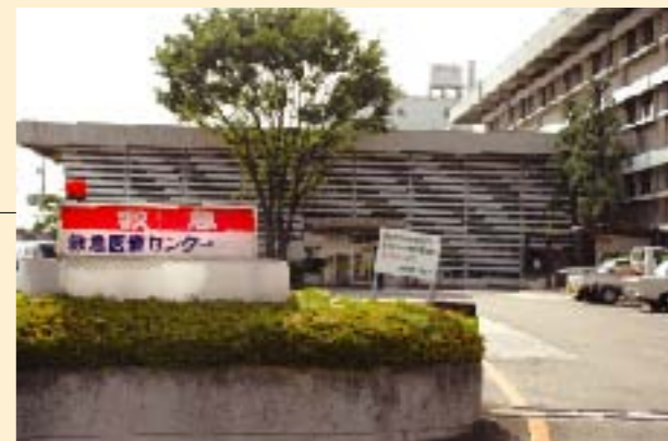
小児初期救急医療センターのある甲府市医療福祉会館

小児初期救急医療センターが、一カ所しかなく、子どもの具合が悪い時に車を運転していくのが大変だった。県内に