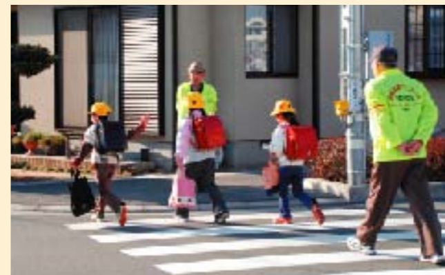
下校時に子どもを見守る老人クラブの方々

市から援助が出てとても助かるが、長時間預けると高額になってしまつて。依頼会員は協力会員を三人程度の中から選ぶことができる。また