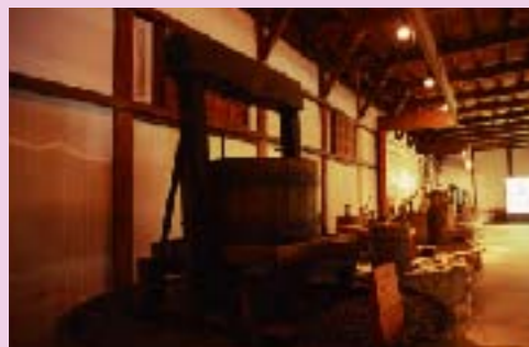
会場となったワイン資料館に展示された醸造器具など