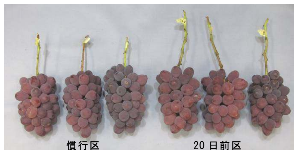
図2 ジベレリン処理時期の違いと果実形状 (2010)

Z) (独) 果樹研究所作成ブドウカラーチャートによる値 アルファベットの異符号間に有意差あり (Tukey法、5%)