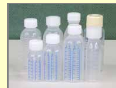
水薬容器の例(医療用医薬品)

東京都は、子供のいる家庭の保護者に対し、子供の誤飲事故の危険性、医薬品等保管の重要性及びチャイルドレジスタンスの考え方などについて普及啓発すること 国は、子供の誤飲事故情報の収集・提供等、誤飲防止対策に積極的に取り組むこと 薬剤師会は、医薬品の保管に対して、薬局窓口で消費者啓発を行うこと