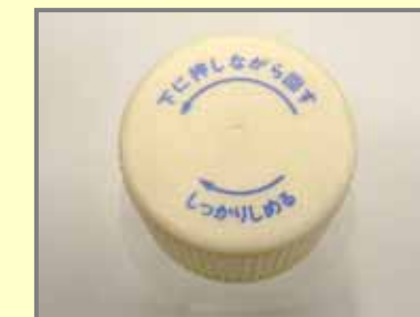
CR容器(押しまわし式)のキャップ