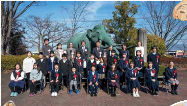
表彰式参加者集合写真 [R6.2.10]

本 コンクールで受賞した子どもたちの中には、翌年さらに完成度を高めた研究成果を見せてくれる子どもも少なくありません。