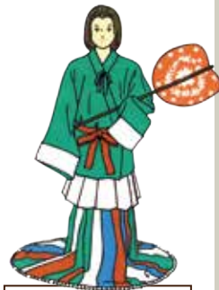
高松塚古墳壁画 女官装束