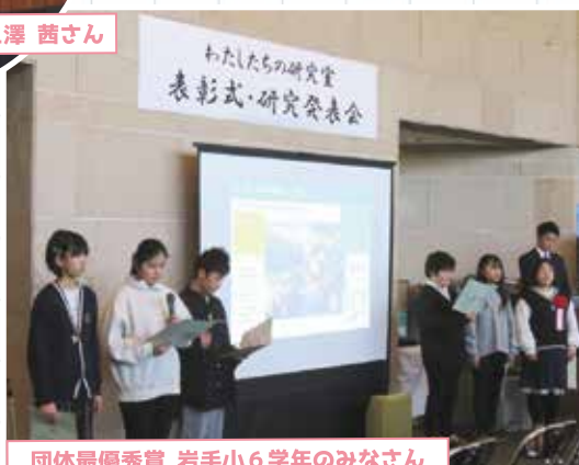
団体最優秀賞 若手小6学年のみなさん