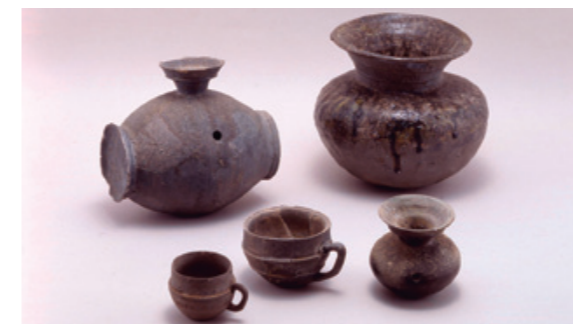
大陸から伝わってまだ間もない頃の須恵器

今から1,600年前の古墳時代中頃には、朝鮮半島からさまざまな文物が伝来しました。その一つに現代の陶器のルーツである須恵器があります。朝鮮半島から伝えられたばかりの頃の須恵器は、縄文時代から使われていた土器と比べて堅く、形も珍しいものでした。山梨県における須恵器の登場と、やがて消えゆく姿に迫ります。