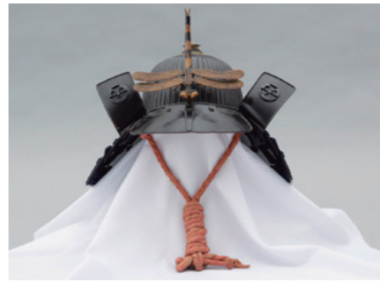
くろうるしめりくじゅうにけんすじかぶと 黒漆塗六十二間筋兜(水上哲朗氏蔵) トンボの飾り付き