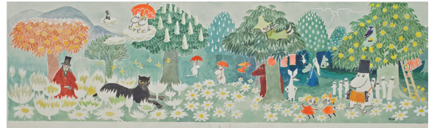
「楽しいムーミン一家」表紙絵 タンペレ市立美術館所蔵