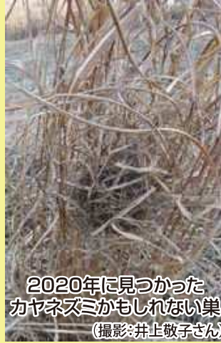
2020年に見つかった カヤネズミかもしれない巣