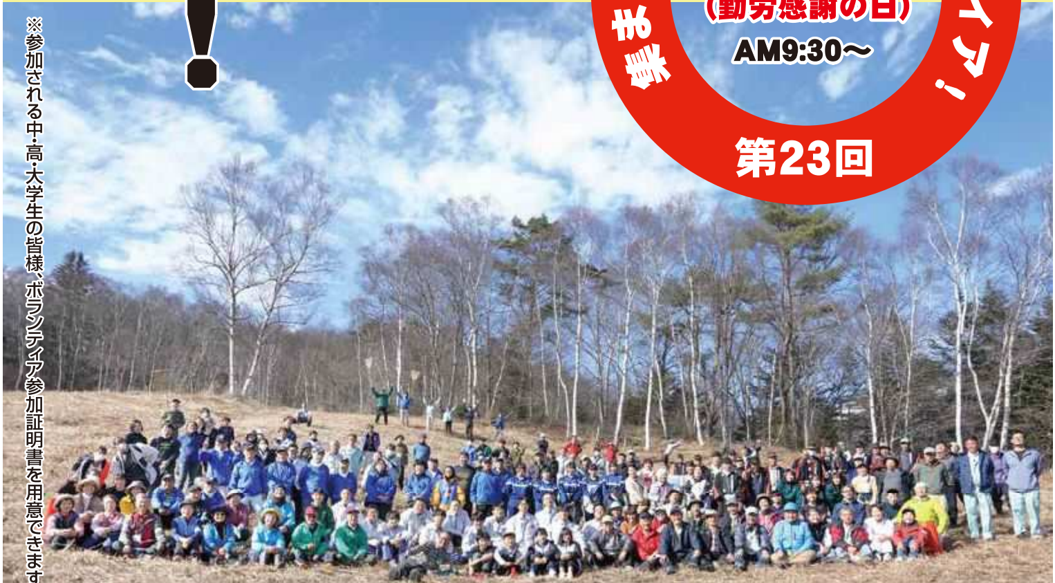
第22回 乙女高原の草原を守る! 記念写真 2023.11.23