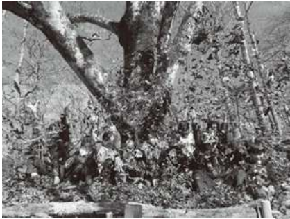
キッズボランティア ブナじいさんに落ち葉のふとん