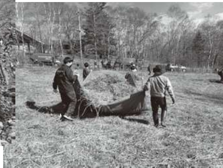
刈った草の運び出し