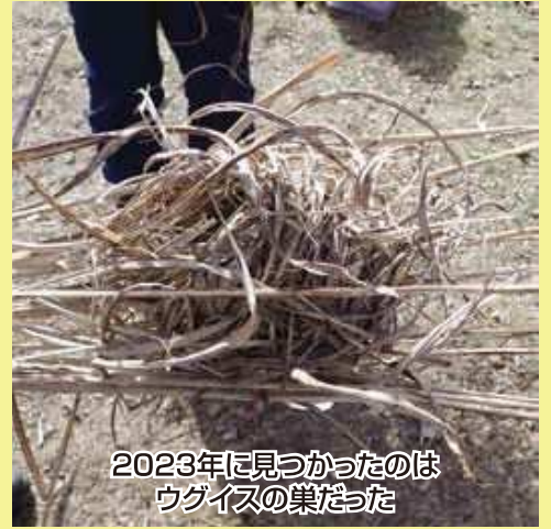
2023年に見つかったのは ウグイスの巣だった

カヤネズミは草原に住む日本最小のネズミ。 乙女高原にいるかも。巣が見つかるかな。