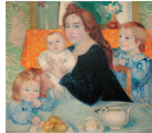
《家族の肖像》1902年 個人蔵

本展では、世界初公開となる作品を含む約100点を通して、ドニの子どもたちの成長をたどりつつ、家族への愛情に満ち溢れている、ドニの芸術世界を紹介いたします。