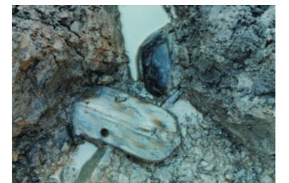
勝沼氏館跡から出土した木製品

甲州市は山梨県を代表する遺跡が数多くある地域です。中でも武田信玄の叔父、武田信友・父子ゆかりの勝沼氏館跡は、国の史跡にも指定されています。今回は、甲州市が行った調査で発掘された出土品から中世の武田一族の豪華な暮らしを探ります。