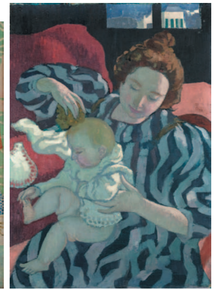
《子どもの身づくろい》1899年 個人蔵