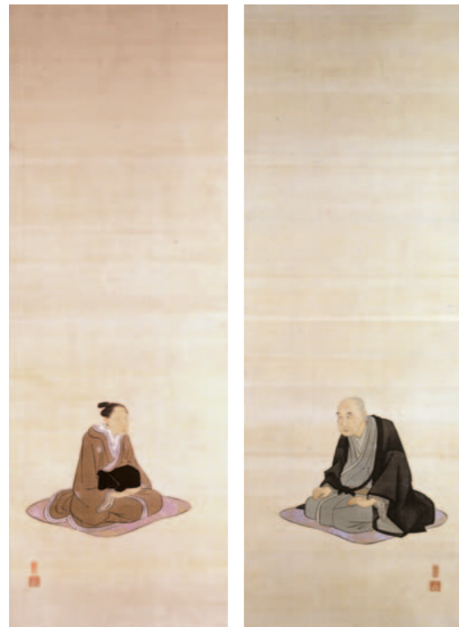
歌川広重 《五代目 大木喜右衛門夫妻像》 天保12(1841)年頃