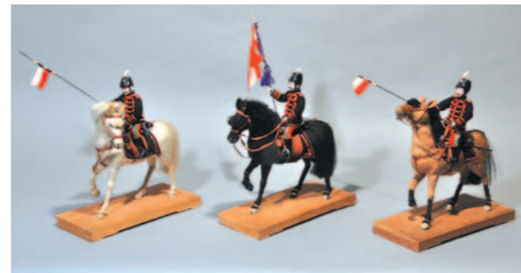
大木平蔵《騎馬軍人人形》 明治28(1895)年