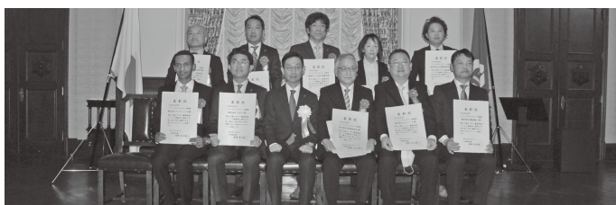
令和2年度 YAMANASHIワーキングスタイルアワード表彰式