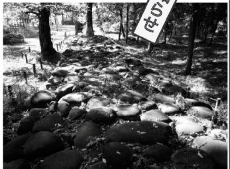
山梨市万力公園内の雁行堤 (がんこうてい)