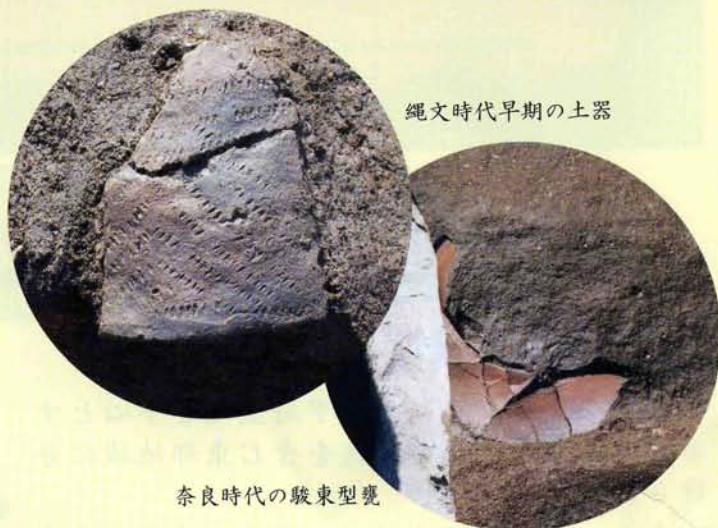
縄文時代早期の土器

縄文時代早期と奈良時代では年代が大きく違いますが、静岡県からの影響が強いという点で共通していることが遺物から分かりました。それぞれの歴史的背景は異なりますが、静岡県から人や土器が流入した結果、生じた現象だと考えられます。