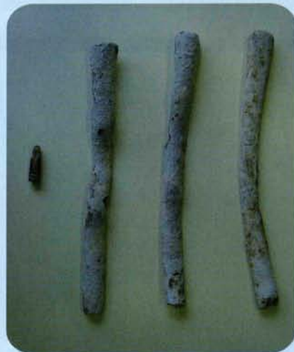
甲府城跡出土の鉛製品資料