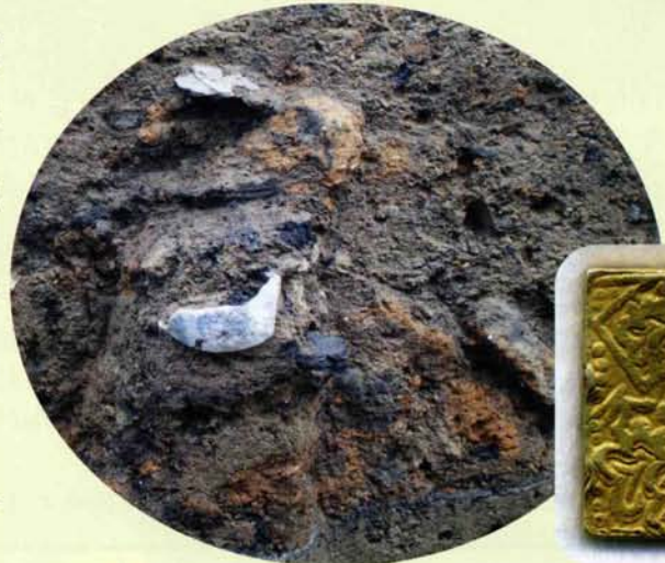
被熱した磁器が見られる焼土層

発掘調査では、度重なる洪水や氾濫に対応するため、石垣を築き盛土による嵩上げを繰り返しながら高さを増していく状況が検出されています。また文政4（1821）年1月16日に起こった鰍沢文政大火の爪痕となる被熱した陶磁器の混在した焼土層や、近世以降と推定される地震の痕跡である噴砂など、多くの災害に見舞われた様子が確認されています。一方、「元禄一分判金」が建物基礎の石垣脇から出土していることから、家や蔵を建てる前に繁栄の祈りを込めて大地に奉納されたものではないかと考えられます。これらの検出状況から、河岸を守るために自然との共生を図りながら洪水常習地帯に生き続けた人々の息遣いや祈りのこころを読み取ることができるでしょう。