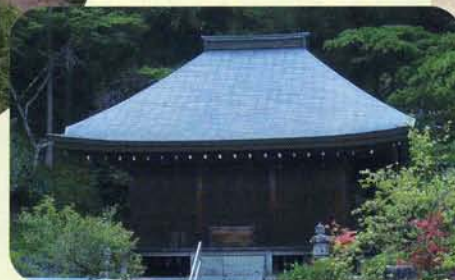
古観音遺跡 (写真は長作観音堂)