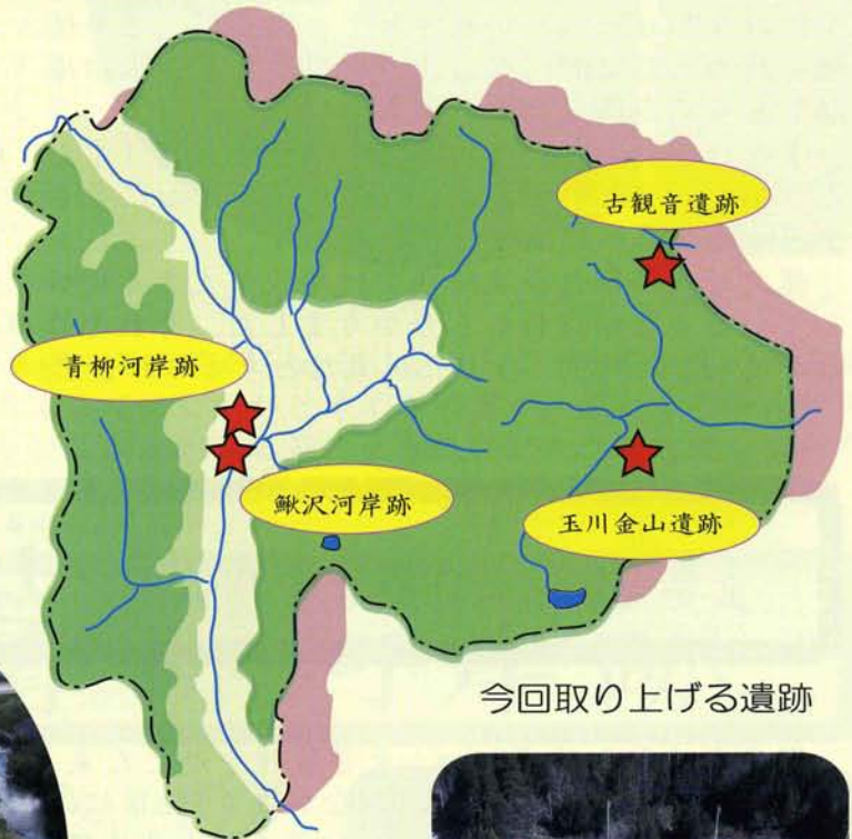
今回取り上げる遺跡

今回は、今年度調査を実施した峡南と東部地域にある4つの遺跡を取り上げ、遺跡からみられる地域性について取り上げていきたいと思っています。