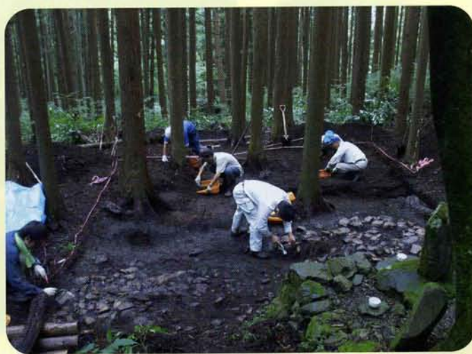
発掘調査のようす

しかし地元では代々「この観音堂は、元は『古観音(ふるかんのん)』にあったものだ」と伝えられてきました。『古観音』はこの地点から神楽(かぐら)入沢(いりざわ)沿いに約1 km登った、三頭山(みとうさん)山腹にあります。この伝承をもとに、山梨県内中世寺院分布調査の一環として古観音遺跡の発掘調査をしたところ、2間×2間の礎石建物跡(そせきたてもものあと)と集石遺構(しゅうせきいこう)を確認しました。この礎石が観音堂のものかは不明ですが、中世から近世にかけての建物であったと思われます。でもなぜこんな山奥に寺院や建物があつたのでしょうか？実は観音堂が建つ場所は、上野原や富士吉田・奥多摩・甲府盆地など各方面への道が交差する交通の要衝でした。中世には、地元有力者の財力により、この地に立派な観音堂が建立されたと考えられます。