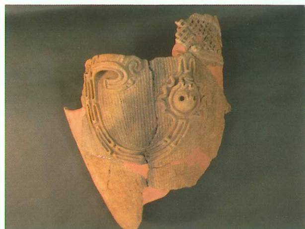
上コブケ遺跡 B区 人面装飾付土器

C区は、A区と隣接していて、同じ時期のムラの跡だと思われます。竪穴式住居跡が5軒、掘立柱建物跡が11棟、土坑や溝など沢山の遺構や遺物が発見されました。特に、第5号住居跡では、住居壁の内側に巡らされた溝の中から、ほぼ完形の土師器杯や皿が発見されました。これらは、建物内の四隅に近い部分に埋まっていた。