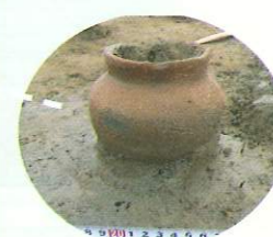
廻り田遺跡 第2号溝状遺構出土 小型片口短頸壺