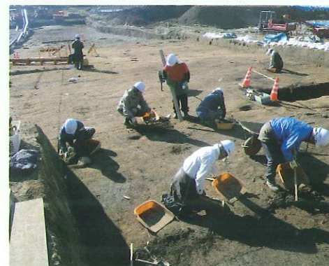
膳棚遺跡 調査風景