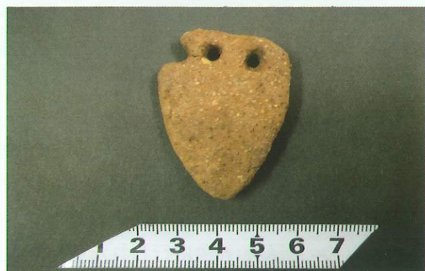
上コブケ遺跡 B区 土製装飾品