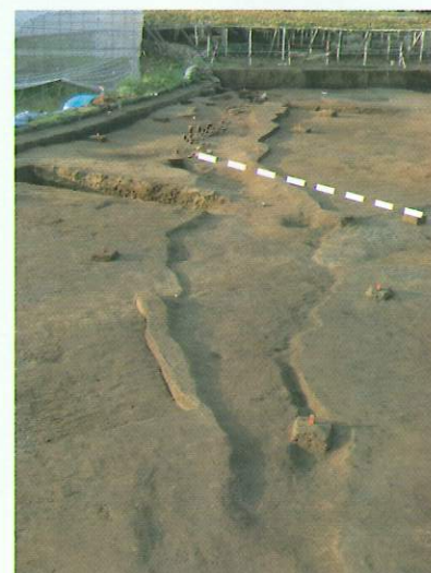
廻り田遺跡 第2号溝状遺構検出状況

廻り田遺跡は、平成23年9月1日から11月30日まで、調査面積約2,096㎡の発掘調査を行いました。調査の結果、今から約1,700年前の古墳時代の遺構・遺物が確認されました。遺跡は、弟川の左岸に近接しており、当時も河川の影響を受けた跡として、旧河道や溝状遺構が確認されました。そのうちの長さ約35m、最大幅約5mの第2号溝状遺構から、約700点の高坏や甕など土器片が見つかりました。小型片口短頸壺が1点だけ溝状遺構内に置かれるような状態で発見されました。この溝からは、高坏の破片が多く出土しているため、当時の周辺集落に住む人々が、水場に関連する祭祀・儀礼行為をしたのかもしれない。