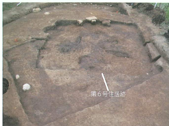
上コブケ遺跡 A区 第6号住居跡検出状況