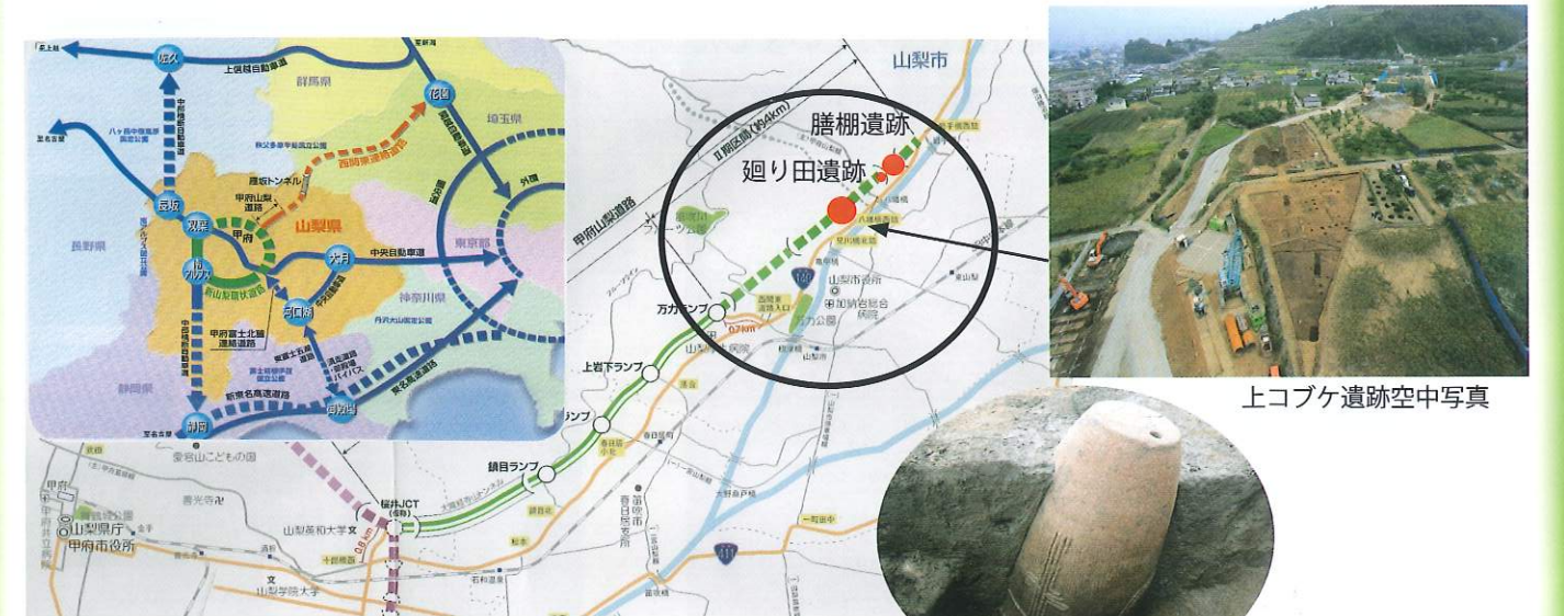
西関東連絡道路路線計画図

この道路は、埼玉県深谷市の関越自動車道花園 IC から山梨県甲府市桜井に至る延長約 110km の「地域高規格道路」です。山梨県内の高規格道路には、東西軸の「中央自動車道」・南北軸の「中部横断自動車道」があり、それを補完する「新山梨環状道路」や「西関東連絡道路」といった地域高規格道路が位置づけられています。現在、それぞれ整備が続けられていますが、「西関東連絡道路」では、甲府山梨道路部分とした区域があり、すでに甲府市和戸から山梨市万力までのⅠ期整備部分は開通しており、峡東地域と甲府市内を結ぶ主要道路として利用されています。