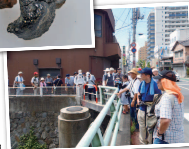
甲府城三の堀(若松町)