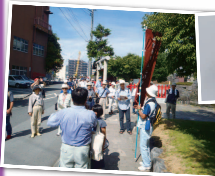
ぶらっと甲府城下町のようす(庄城稲荷)