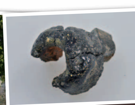
金がつくフイゴ羽口 中央二丁目出土