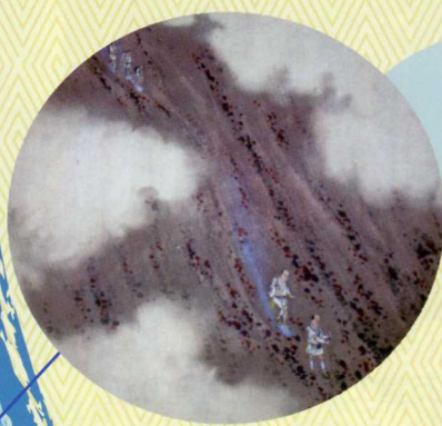
「頂上より五合目迄 下り道砂走り」