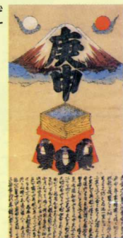
猿の描かれた絵札

さらに一合目鈴原社わきの山小屋跡の調査では、小石に法華経の経典を墨で記した‘一石経塚’が見つかっています。これは、願をかけたたり、また豊作を祈って造られたもので、江戸時代の終わり頃に流行しました。このように山中からも様々な信仰の痕跡が見つかっています。