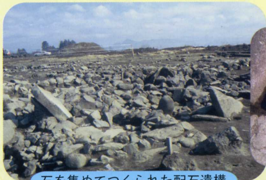
石を集めてつくられた配石遺構