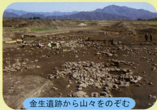
金生遺跡から山々をのぞむ

遺跡は縄文時代後期～晩期の遺跡ですが、配石遺構とよばれる、石を集めた祀り場の跡も見つかっていることから、いわゆる普通のムラの跡ではなく、祀りの場を中心とする祭祀的な意味合いの強い遺跡だと考えられています。石の祀り場からは焼けた人骨や石棒、土偶などが見つっていますが、特に第2号配石遺構から見つかった、中空土偶は印象的です。多くの土偶は壊されてバラバラになった姿で見つかりますが、これは少し欠けた部分はあるもののほぼ完全な姿をしており、またその姿も特徴的です。もしかすると、これは何度も使われた女神像の一種かも知れません。このような祀りの場をもつムラだからこそ、周囲に神々の山を見渡すことができるこの場所が選ばれたのではないのでしょうか？