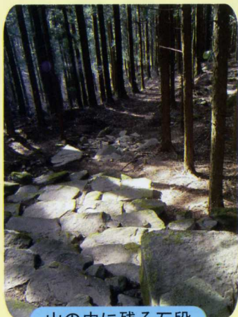
山の中に残る石段

調査の結果、仏堂と思われる建物などが見つっています。昭和37年に甲州市勝沼町柏尾から見つかった、平安時代おわり頃の経筒には‘米沢寺の千手観音の前で写経した経文を、柏尾山寺（大善寺）まで運んで埋納した’ことが記されていますが、そこに記される米沢寺はこれまではっきりした所在がわからず、いわば幻の寺でした。しかし、杣口に現存する「米沢寺雲峯寺」の寺院名などから、もしかするとこの奥