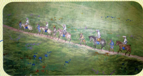
「吉田口之裾野」部分

左の絵図は、肥後熊本・細川家の御抱え絵師であった「杉谷行直」によって描かれたものと考えられています。行直は自ら登山して、富士山の雪解け水でこの図巻の下絵をしたためたようですが、ここには富士登山の様子がよく現わされており、登山を迫体験できるようです。