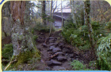
見つかった石列 (奥は富士御室浅間神社)