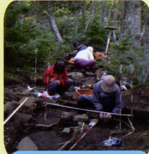
図面を作成している様子