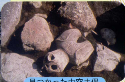
見つかった中空土偶