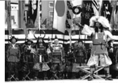
「信玄公祭り」(4月6日~8日)