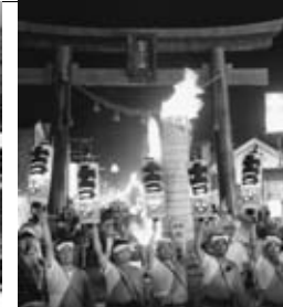
「吉田の火祭り」(8月26日) (県指定民俗文化財) (日本三奇祭の1つ)