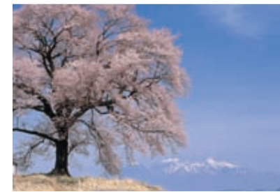
3 八ヶ岳とわに塚の桜