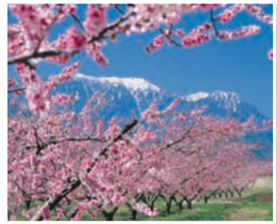
2 新府桃源郷と南アルプス