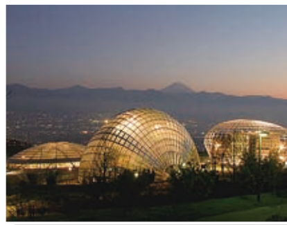
8 笛吹川フルーツ公園