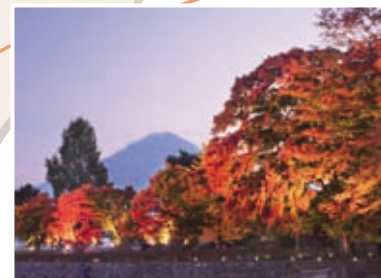
14 河口湖もみじ回廊