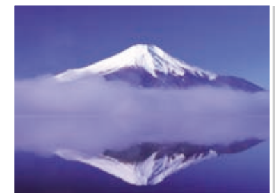
15 山中湖に映る逆さ富士