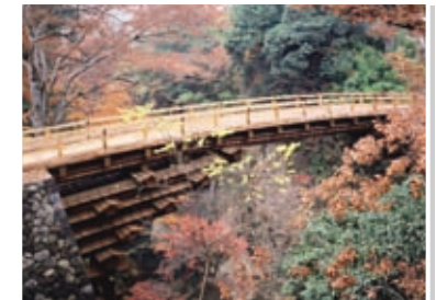
13 猿橋(日本三奇橋の1つ)