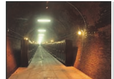
12 勝沼トンネルワインカーヴ