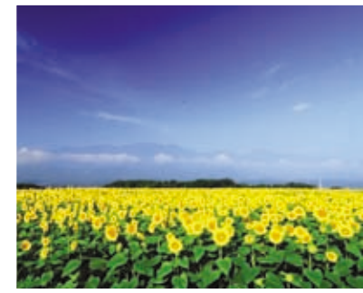
1 明野のヒマワリ畑