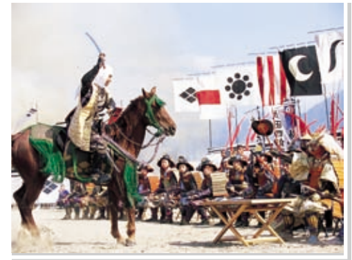
10 石和温泉郷(川中島合戦戦国絵巻)