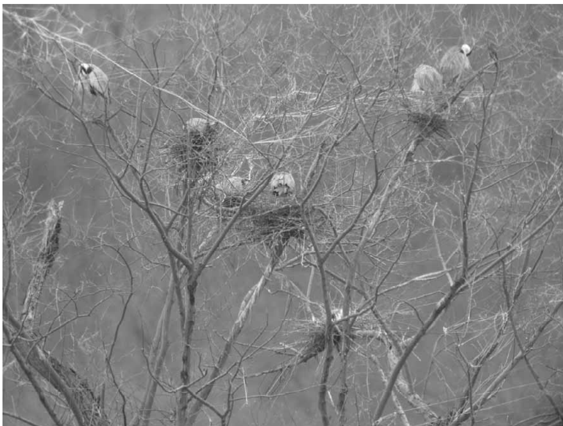
図3 ビニルひも張り実施後も営巣，育雛するアオサギ