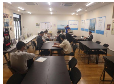
R6.9.3 警察署代替施設（SDGsまなび館）視察状況