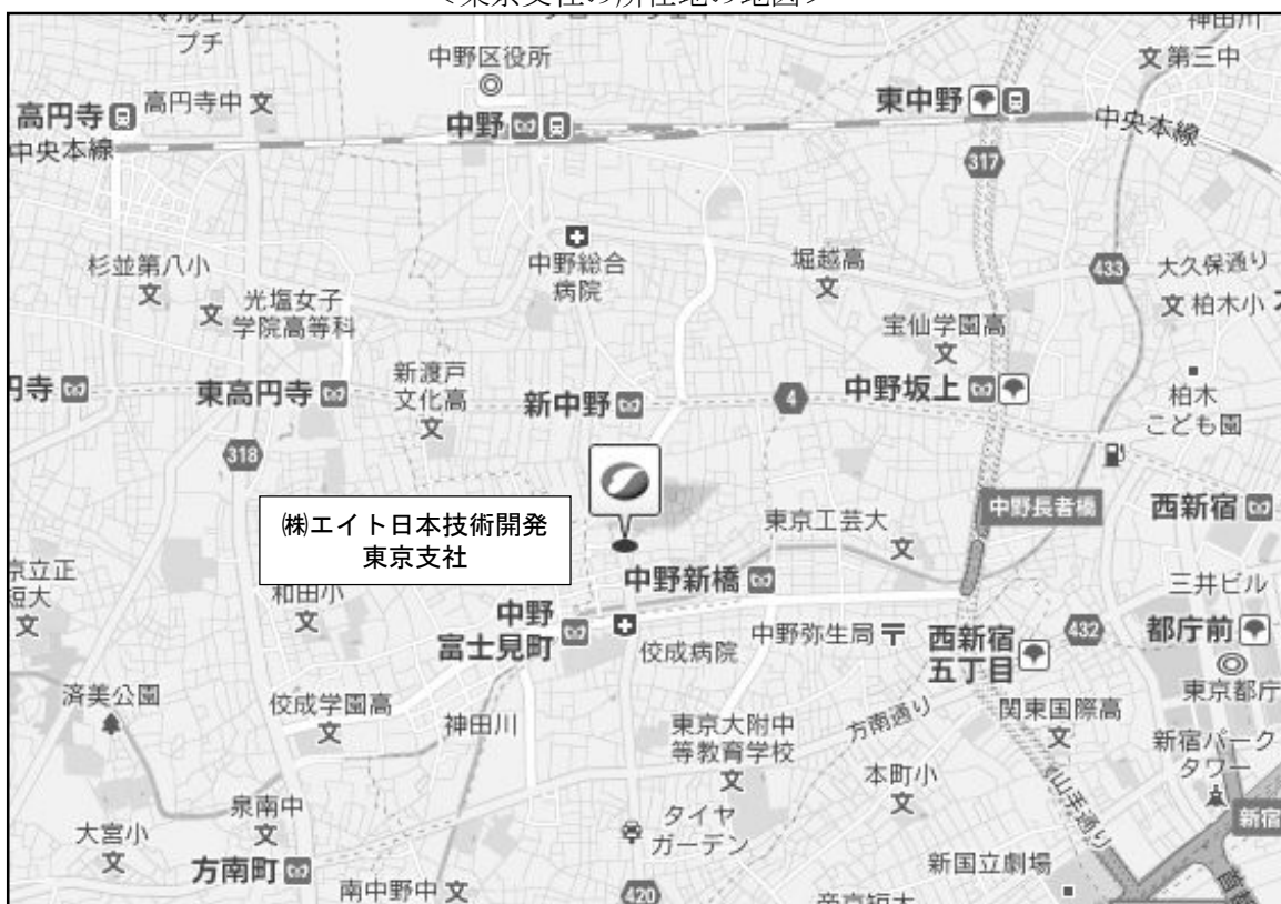
<東京支社の所在地の地図>

URL： http://www.ejec.ej-hds.co.jp/index.html /