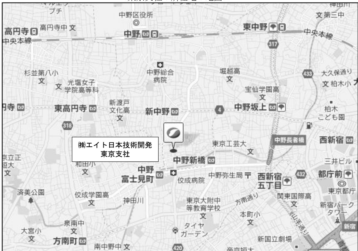
<東京支社の所在地の地図>

URL： http://www.ejec.ej-hds.co.jp/index.html /