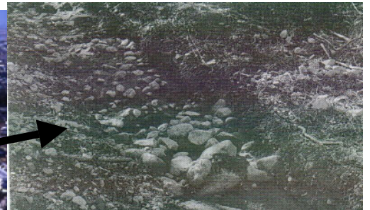
後円部の葺石(昭和60年 14号トレンチ)