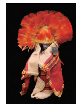
《小型女性人物像》16世紀初頭 (ペルー文化省・トゥクメ遺跡博物館蔵)

アンデス文明最後の国家、インカ帝国。彼らは文字を持たなかったため、その全貌は謎に包まれていました。今回の展示では、考古学・人類学・歴史学など、さまざまな分野の最新研究を基にインカ帝国の始まりから、スペインに支配されたその後までを紹介します。