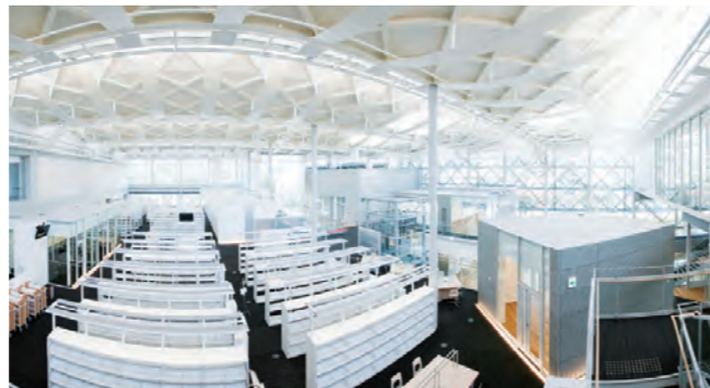
幅広い分野の図書を並べるメインの閲覧エリア(2階)