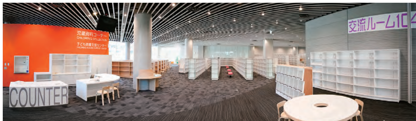
たくさんの本と出会うワクワク感を演出した「児童資料コーナー」と、さまざまな用途で利用できる「交流ルーム」(1階)