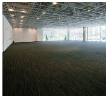
講演会や展覧会などが開催できる「イベントスペース」(1階)