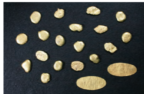
戦国時代の甲州金(県立博物館蔵)

戦国時代を代表する甲斐の金山と、江戸時代を代表する越後・佐渡の金銀山。当時、そこに暮らしていた人々の営みや卓越した採掘・製錬の技術、製造された金銀貨の数々を通してかつて日本に存在した「黄金の国々」の姿を紹介します。