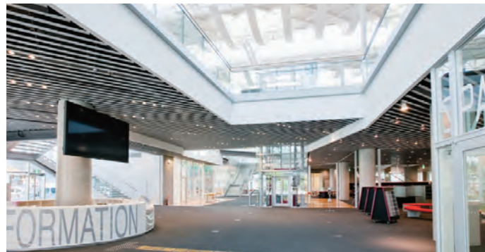
広く明るいメインエントランス(1階)