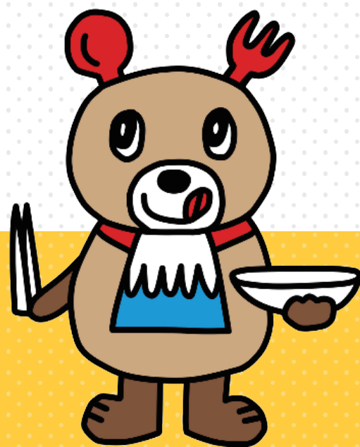
かんしょくま やまなし食品ロス削減推進マスコット