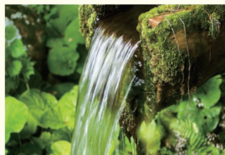
湧水をミネラルウォーターに活用

若彦トンネルからの湧水をミネラルウォーターとして活用するため、水質調査などを実施します。