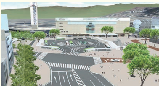
甲府駅南口駅前広場(完成後イメージ)