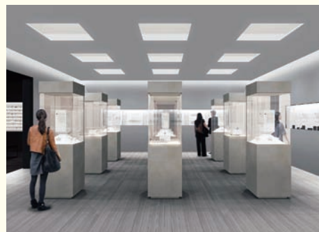
山梨ジュエリーミュージアム・展示室(イメージ)