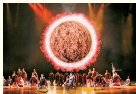
富士の国やまなし国文祭(会期:1月12日~11月10日)

本県の経済活性化およびイメージアップを図るとともに、県民の見るスポーツを振興するため、ヴァンフォーレ甲府の練習環境整備に対し助成します。