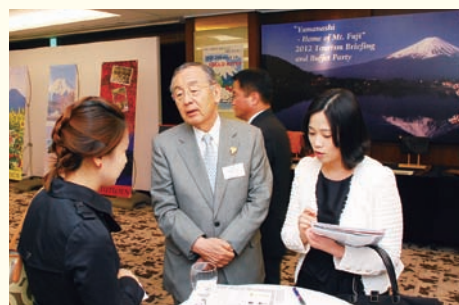
韓国・ソウル市で山梨の魅力をトップセールス