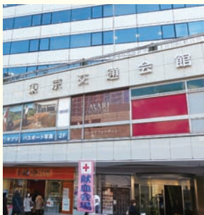
「やまなし暮らし支援センター」を開設する有楽町・東京交通会館