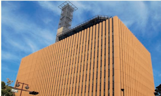
県の防災拠点となる防災新館