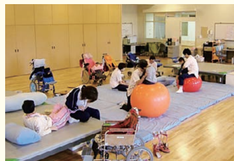
小児リハビリテーション

質の高いがん医療を提供するため、ゲノム解析センターにおけるがん患者の遺伝情報の解析などに対し助成します。