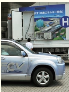
燃料電池自動車の普及促進