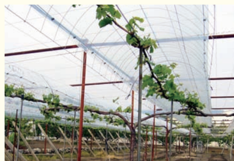
ブドウ簡易雨よけ