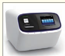
最新のゲノム解析装置 (県立中央病院)