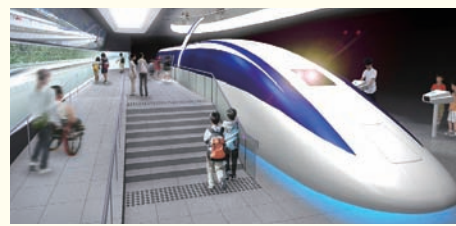
世界最速記録を出したリニア車両を展示(イメージ)

山梨リニア実験線での走行試験再開に向け、平成26年度早々のリニューアルオープンを目指して、子どもから大人まで楽しく学べる空間として再整備を行います。