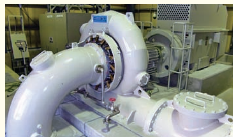
深城ダムの放流水を利用した小水力発電