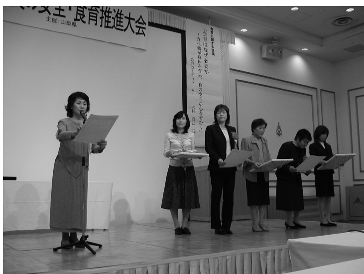
食の安全・食育推進大会