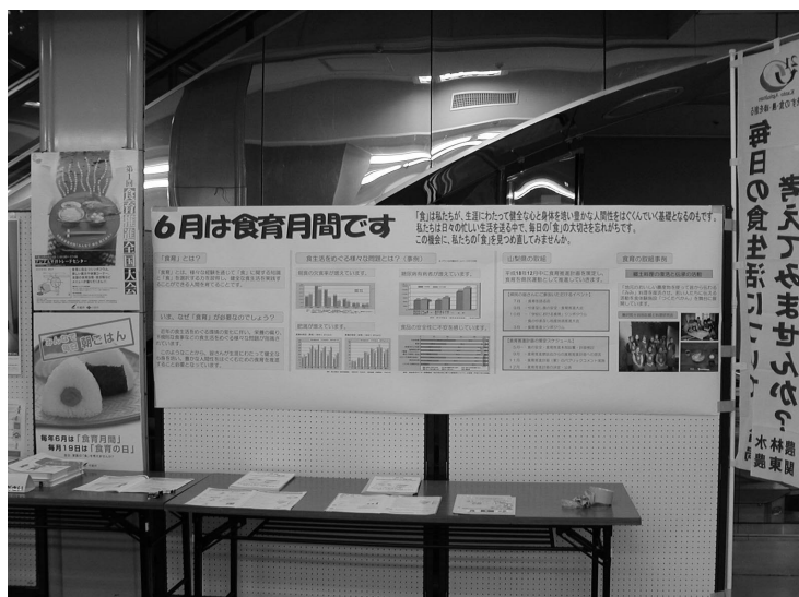
食育月間啓発活動