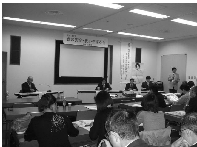
食の安全・安心を語る会