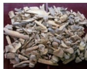
縄文人が食べた獣の残骸 (長野県北相木村板原岩陰遺跡 出土)

自然と共に生き、自然の中から必要な分の食料を得ることが基本だった縄文時代。今回の特別展では、全国各地の縄文遺跡から出土した食に関する資料を展示し、日本の食文化の原点である縄文人の豊かな食生活と精神文化を紹介します。