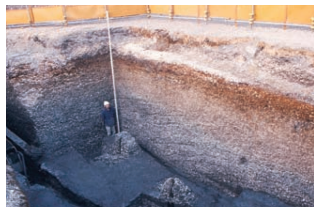
4mにおよぶ中里貝塚の貝層(東京都北区)