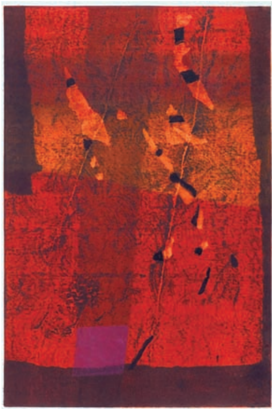
《石の花(赤)》1960年 木版 県立美術館蔵

甲府市に生まれた萩原英雄(1913-2007)は、戦後の日本を代表する版画家の一人として活躍し、独自の木版画作品は国内外の版画展で高く評価されました。その一方で、生涯にわたり油彩画、コラージュ、墨彩画など多彩なジャンルの作品も制作しています。