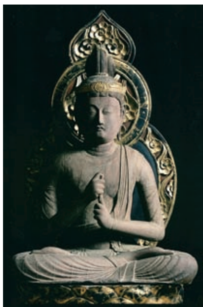
重要文化財 木造大日如来坐像 (木造大日如来及四波羅蜜菩薩坐像のうち) 宝珠寺蔵

国民文化祭の開催期間に合わせた今回の企画展では、国宝・重要文化財を中心とした「山梨の名宝」を一堂に集め、それらを育ててきた山梨の豊かな歴史を振り返り、さらに将来へと受け継いでいくことの大切さを伝えます。