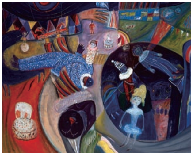
《大サーカス》 1972年 油彩・麻布 県立美術館蔵

生誕100年を記念した今回の特別展では、版画や油彩画と併せて、萩原自身が集めたコレクションの中からさまざまな作品を展示し、萩原英雄の新たな魅力を探っていきます。また、シリーズ作品も全て公開し、総点数約180点により萩原の豊かな作品世界を紹介します。