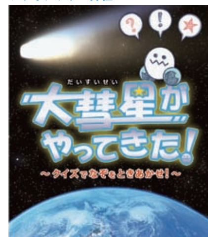
ヘールボップ彗星 (1997年4月、長野県南佐久郡小海町にて撮影)

みなさんは、大彗星を見たことがありますか?なんと数十年に一度ほどしか見ることができません。とても美しい姿をしています。クイズに答えながら、楽しく彗星の謎に迫っていきましょう。