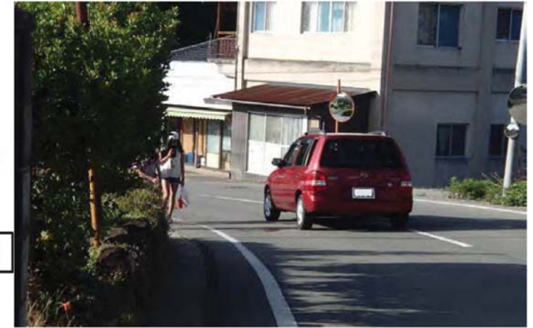
①歩道がないうえ、線形が悪く見通しがきかない状況