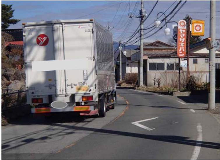
② 起点側より終点側を望む