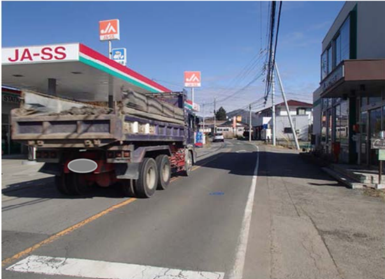
① 起点側より終点側を望む