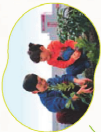
一緒に大きく育みたいね