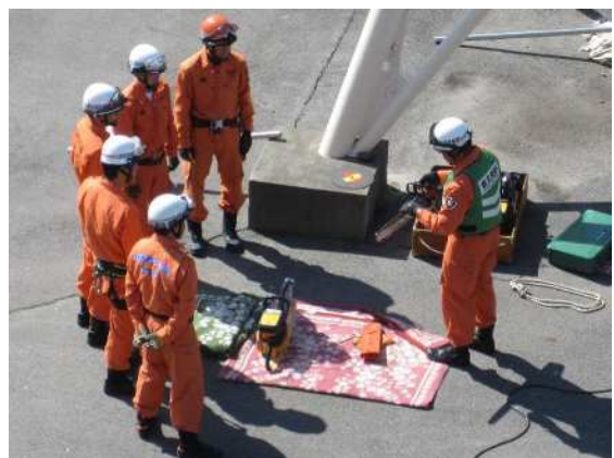
救助資器材取扱訓練