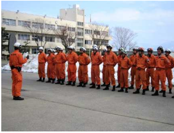
救助訓練（高所からの救助）