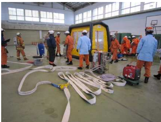
特殊災害対応訓練