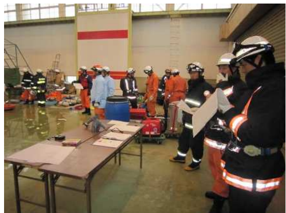
特殊災害対応訓練