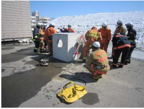
震災時における救助訓練