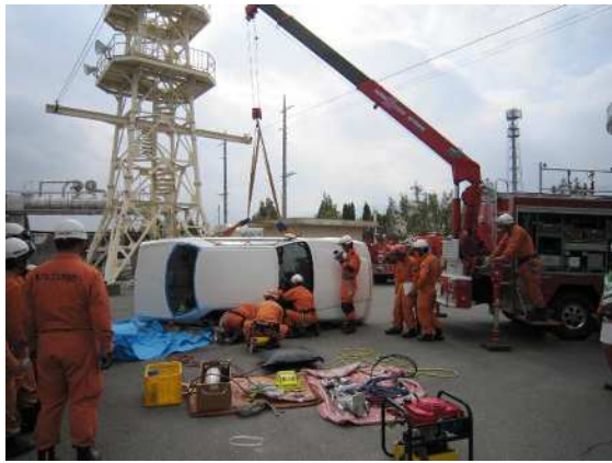
交通事故救助訓練