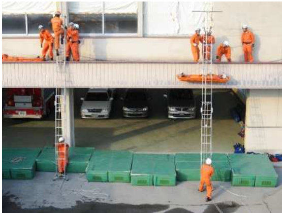
はしご水平救助（二法）