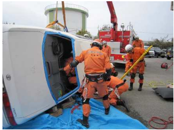
交通事故救助訓練