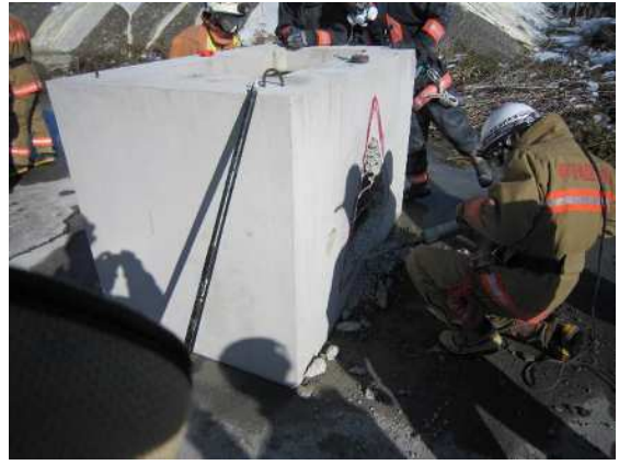
震災時における救助訓練