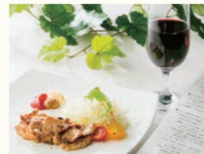
県産ワインにピッタリ! 「甲斐の酒蔵発 酒粕味噌漬け豚ロースステーキ」

オープンカフェ・まるごとやまなし館は、朝9時から夜9時までオープン。県産ワインや県産食材を生かしたメニューを楽しむことができるほか、旬のフルーツを使用したジェラートや、洋菓子店ブルミッシュ(東京・銀座)とコラボした県産フルーツのオリジナルスイーツなど、おいしい山梨を堪能できます。