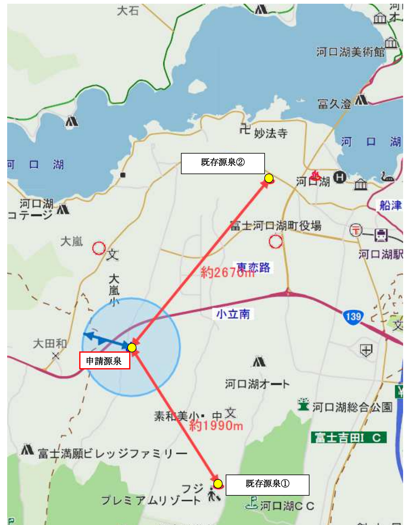
申請地付近の見取り図