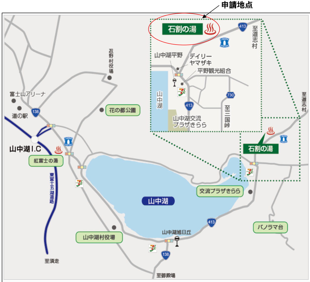
山中湖温泉石割の湯HP参照 (URL: http://www.ishiwarinoyu.jp/access/index.php )