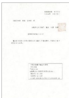
沿線10市町村 議会による早期実現を 求める意見書 (R4.3)