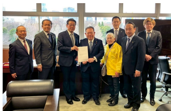
・北杜市中部横断自動車道建設 促進期成同盟会 国への要望 (R8.1)