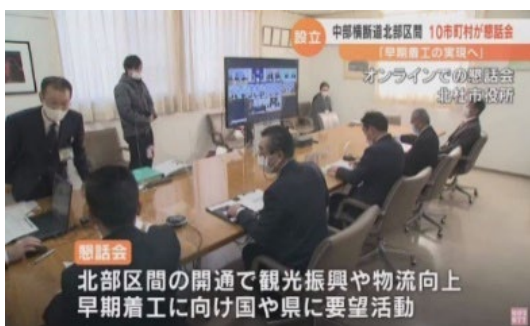
・山梨、長野の沿線10市町村により 早期事業化を求める懇話会を設立 (R4.1)