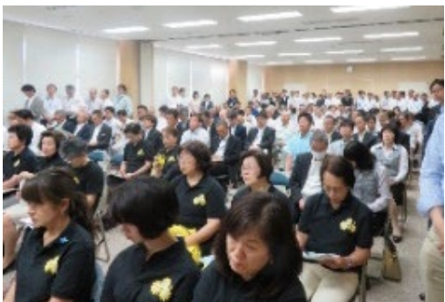
・地元主催の早期整備を求める会 (R1.6)

新たな推進組織の設立、市町村議会からの意見書の提出、度重なる要望活動、地域の熱意が伝わる大会の開催など、早期事業化への期待が高まっている