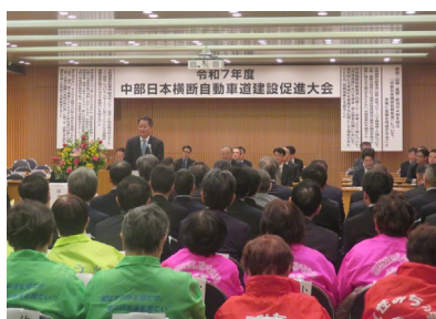
・中部日本横断自動車道建設促進大会 (R7.12)