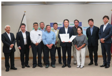
・早期整備を求める要望書の提出 沿線3地区より (R3.8)