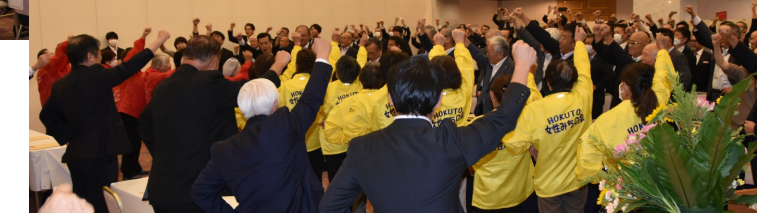
・中部横断自動車道整備促進「開の国」前進大会 (R5.9)