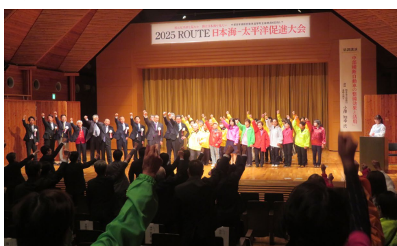
・ROUTE日本海-太平洋促進大会 (R7.10)