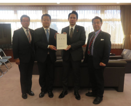
・山梨・長野両県知事と沿線首長 からなる懇話会とで国へ要望 (R7.12)