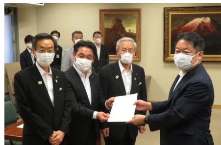
・早期整備を求める要望書の提出 3市長より (R3.8)