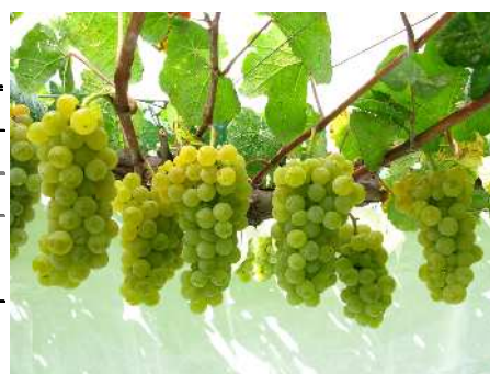
図2 「ブドウ山梨54号」の果実

z: 発病度 = { (指数 × 分生子形成面積別リーフディスク数) / (全調査リーフディスク数 × 5) } × 100、指数は分生子が形成された面積によって0~5の6段階(0:0%, 1:1~10%, 2:11~25%, 3:26~50%, 4:51~75%, 5:76~100%)に分けた。発病度が低いほどべと病耐病性は高い。