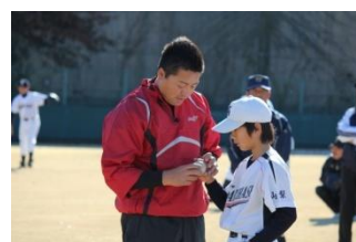
（こんな風に握ってみて）