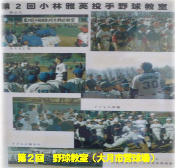
第2回 野球教室（大月市営球場）