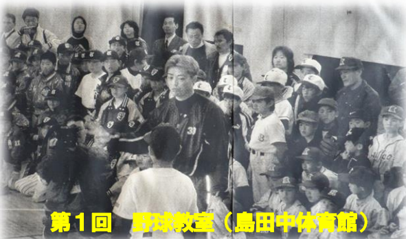
第1回 野球教室（鳥田中体育館）