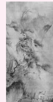
絹本著色夏景山水図 昭和30年6月22日指定

県内に現存する多くの歴史的建造物や美術品の中には、国内でも貴重とされるものが少なくありません。国宝には5点が指定され、大切な文化遺産として保存されています。