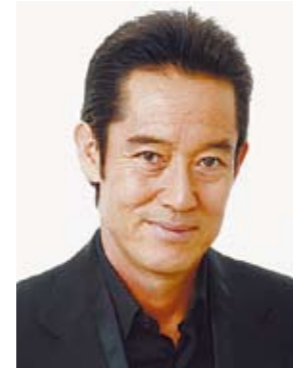
武田信玄公役 俳優 山下 真司さん