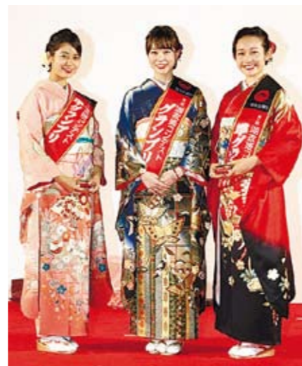
昨年の湖衣姫コンテストでの受賞者 甲州軍団出陣における湖衣姫行列に参加