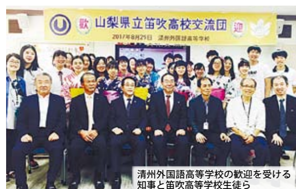
清州外国語高等学校の歓迎を受ける知事と笛吹高等学校生徒ら

県民の日記念行事の会場には、忠清北道広報ブースも出展しますので、姉妹道・忠清北道の魅力を堪能してください。