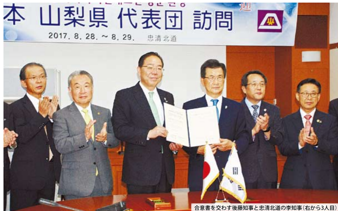
合意書を交わす後藤知事と忠清北道の李知事(右から3人目)

山梨県と大韓民国・忠清北道は、1992(平成4)年に姉妹締結し、今年で25周年を迎えました。