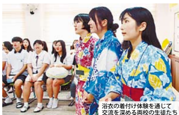
浴衣の着付け体験を通じて交流を深める両校の生徒たち