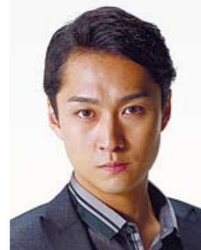
武田信玄公役 俳優 渡辺 大さん