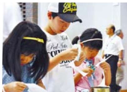
種の模型を飛ばしてみよう

「富士山科学研究所ってどんなところ?」「何をしているの?」 そんな疑問にお応えします。親子で楽しめる実験・体験イベントが盛りだくさんの「富士山研まつり2015」。夏休みの1日、おべんとうを持ってじっくり楽しみましょう!