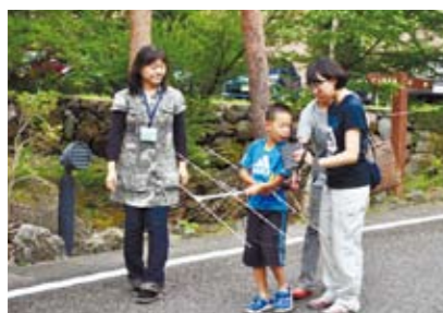
シカを追跡して調査せよ!