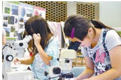
マグマの中の宝石を探そう!

12:00 着ぐるみに着替えて、リスやヤマネに大変身! 森の中で動物気分を味わってみよう!