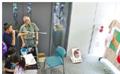
麻酔用の吹き矢を体験!