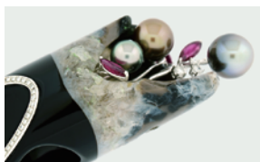
＜待宵＞リング・ペンダント デザイン：米山美香 制作：河野水晶美術 ジュエリーアートクレアール