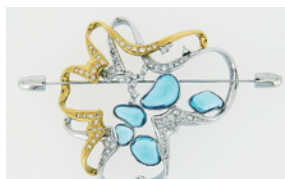
＜山々に守られて…＞ブローチ デザイン：伴野裕子 制作：ジュエリークラフトフカサワ 株式会社ダイアート三枝