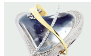
＜惑星＞ブローチ・ペンダント デザイン：内田千奈美 制作：クラウン商会 株式会社 KARAT