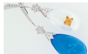
＜星のかけらを集めて＞ペンダント デザイン：小澤恭子 制作：貴石彫刻オオヨリ 有限会社望月クラフト