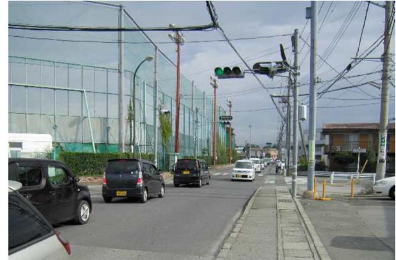
① 竜王中学校南 交差点 (交差点南より)