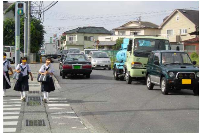
② 竜王中学校南 交差点 (交差点北より)