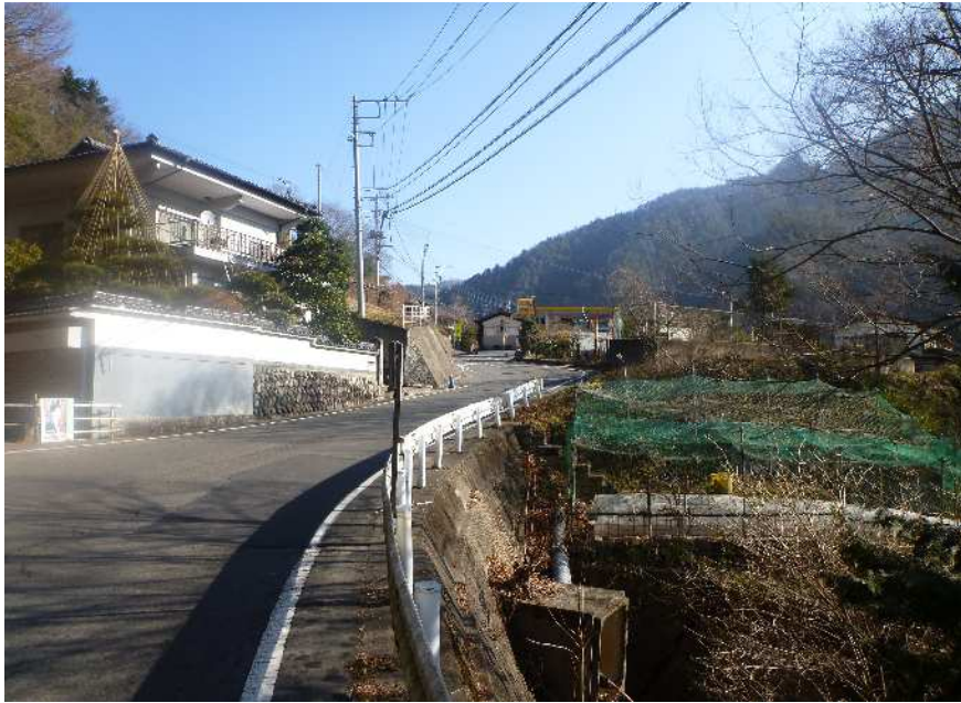
幅員狭小・線形不良