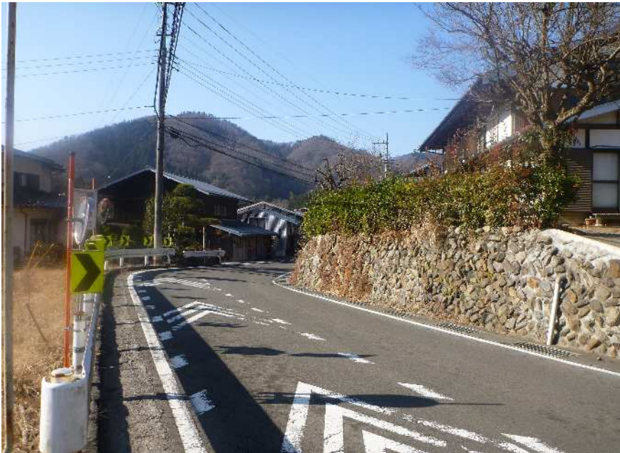
下瀬戸集落内(幅員狭小・線形不良)