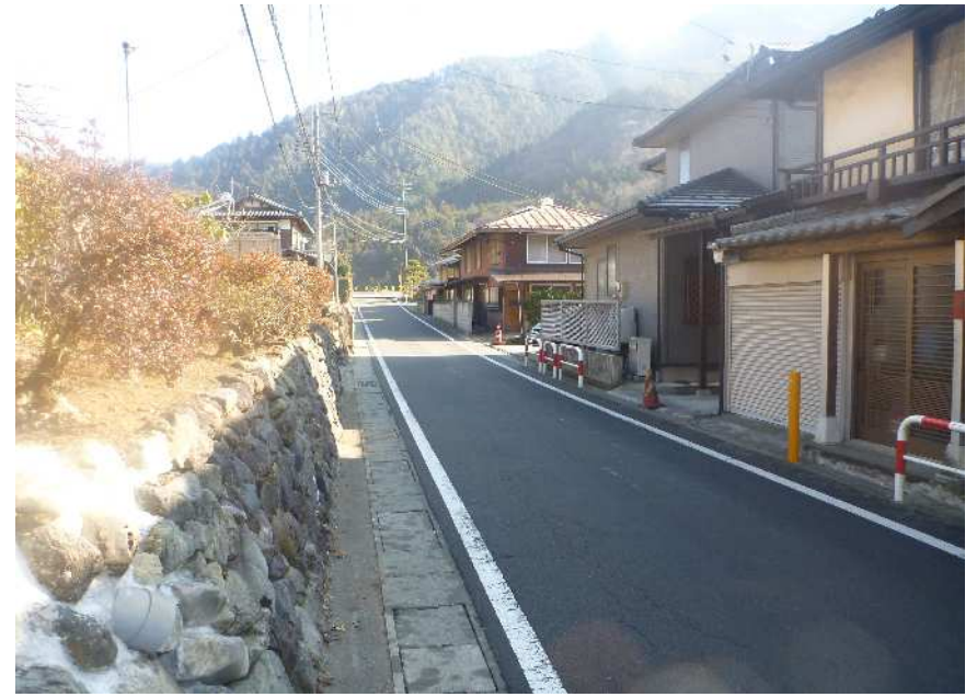
下瀬戸集落内 (小型車のすれ違い困難)