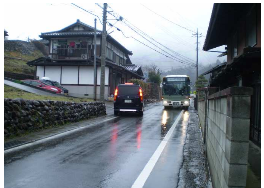
下瀬戸集落内 (バスのすれ違い困難)