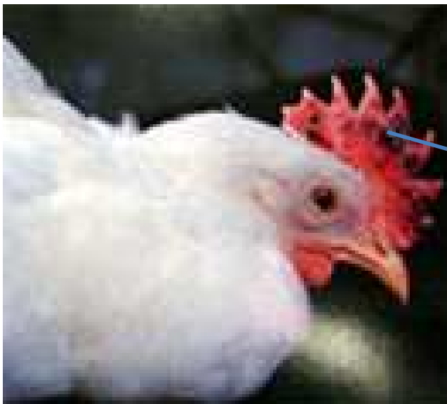
肉冠や肉垂の チアノーゼ