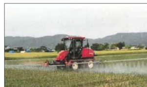
農薬散布による防除