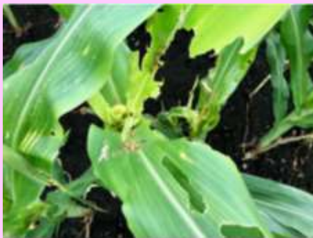
幼虫が葉、茎、子実を食害